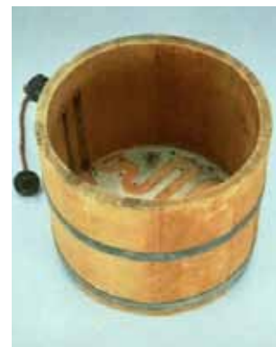
Электрическая рисоварка Ибуки не принесла изобретателю коммерческий успех: применять ее с устойчивым результатом оказалось невозможно.

В 1979 году Sony выпустила гаджет, который по всему миру начали очень активно расхватывать. Его история такова. В отделе звукозаписи группа разработчиков стремилась втиснуть в карманный объем магнитофона функцию записи и пару динамиков, обеспечивающих стереозвук. Согласно корпоративному преданию, «мимо пробежал» Масару Ибука, который выдвинул революционную концепцию: никакой записи и никаких динамиков – их функцию будет исполнять пара наушников. Так появился знаменитый плеер Walkman, который разошелся 100-миллионным тиражом. Первые образцы Walkman имели два выходных гнезда для подключения наушников – чтобы можно было слушать вдвоем с другом. Но впоследствии плеер стал сугубо индивидуальным, как зубная щетка или носовой платок.