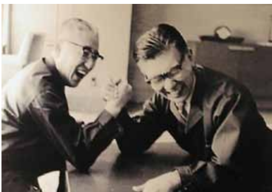
Основатели корпорации Sony – Масару Ибука (справа) и Акио Морита.

В 1957 году появился карманный TR-63 – правда, карман для него следовало иметь очень большой. Его выход